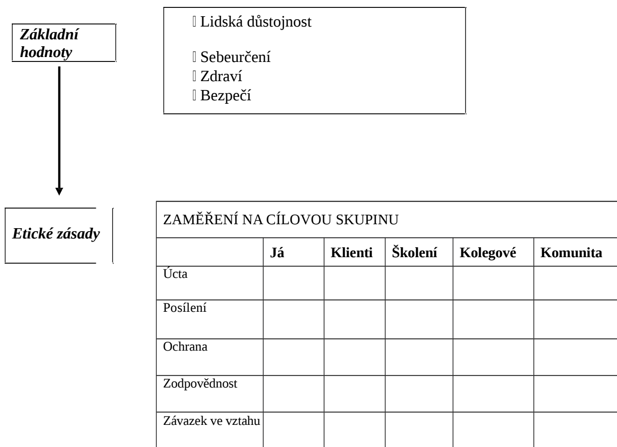
Obrázek 2: Rastr pro etické posuzování podle Etického kodexu EATA